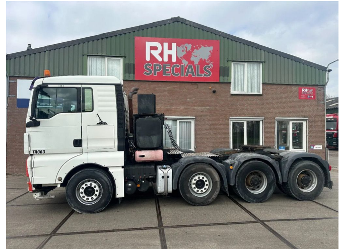
MAN TGX 41.540 160 TON, FULL STEELSPRING, MA... 8x4