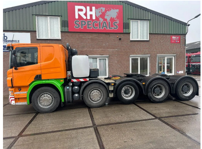
Scania P420 10X4 MANUEL GHEARBOX, 150 TON, HUB R...