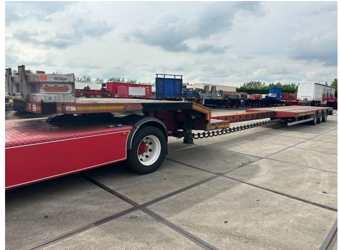
Nootboom LAST AXEL STEERING, 6,8 M EXTENDABLE