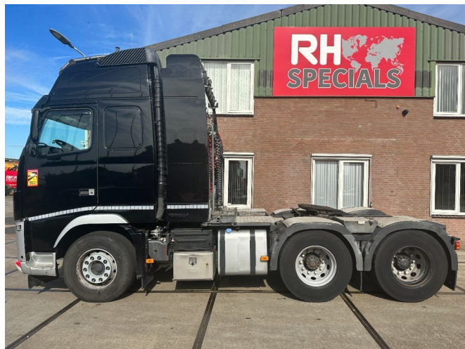
Volvo FH 540 90 TON INTARDER, GEARBOX BROKEN. 6x4