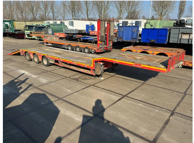
Nootboom MC-48-03, LAST 2 FORCED STEERING, HYDR...