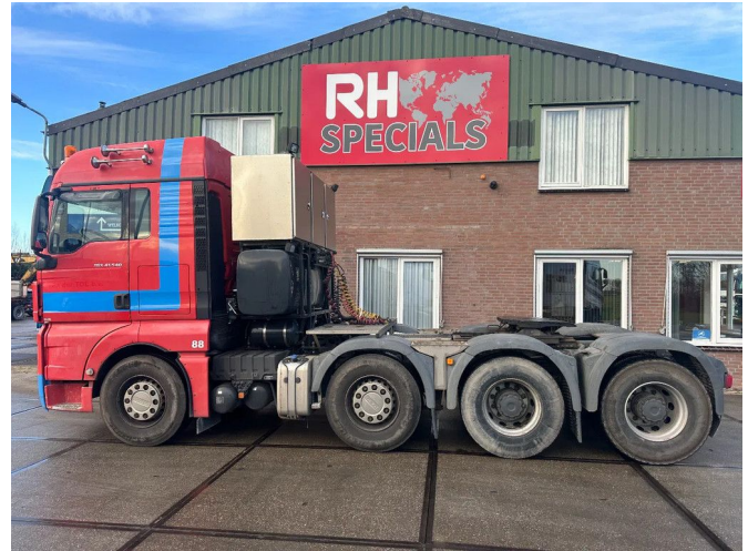
MAN TGX 41.540 STEELSPRING, 160 TON