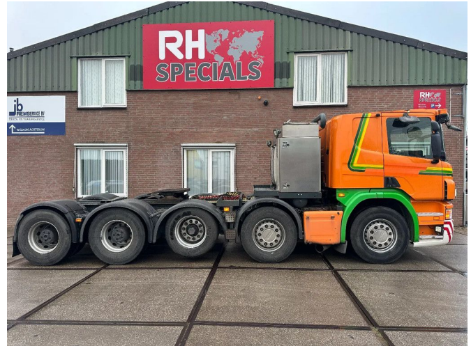
Scania P420 10X4 MANUEL GHEARBOX, 150 TON, HUB R...