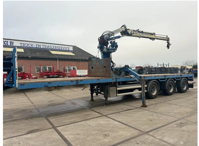
Floor MET HIAB R165-F2, LAATSTE 2 ASSEN GESTUURD