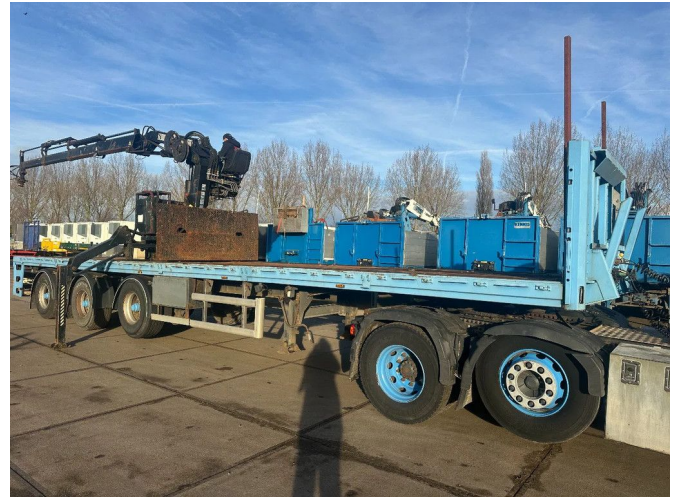
Floor HIAB Roller 165-F3 Rotator