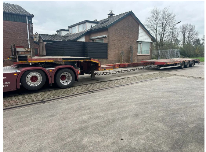
Nootboom APK TOT 16-11-2025 LAST AXEL STEERING, 6,...