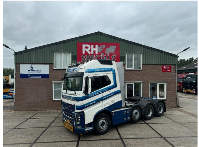
Volvo FH 16.750 8X4 DYNAMIC STEERING I-PARK COOL I-...