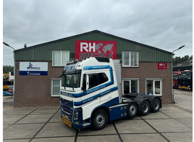
Volvo FH 16.750 8X4 DYNAMIC STEERING I-PARK COOL I-...