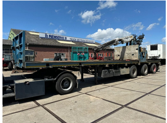
Floor FLO 17 30 H2 + KENNIS R-36 DRUM BRAKES