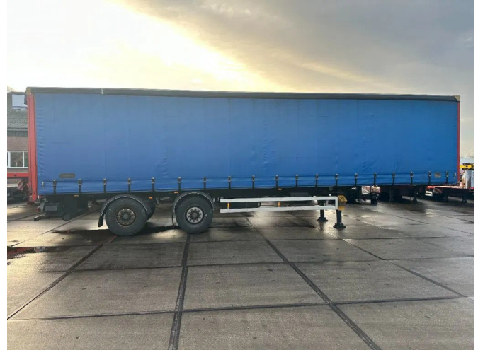
VAN HOOL LAST AXEL STEERING, LIFT 2000KG