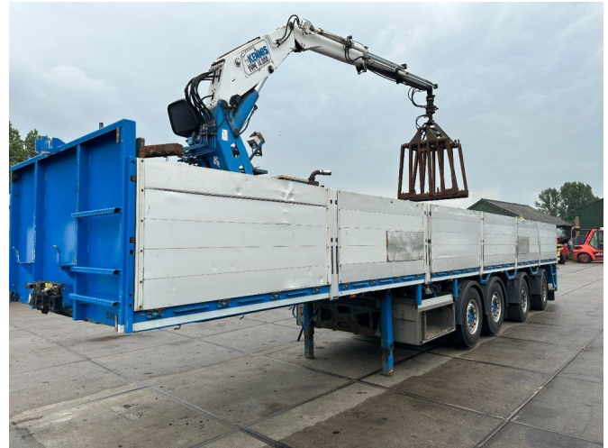
Pacton 4 ASSIGE MET KENNIS 14000 ROLLER KRAAN