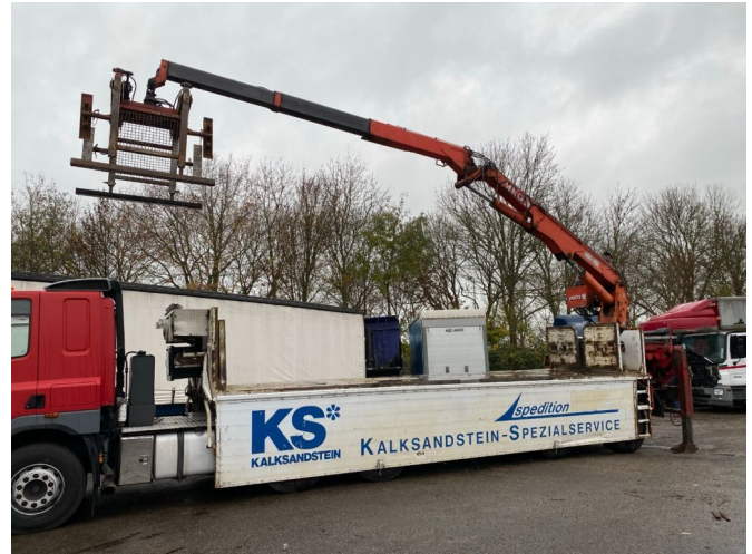
Orthaus 2 ASSIGE STEERING AXEL MKG HLK 330 VG CRANE