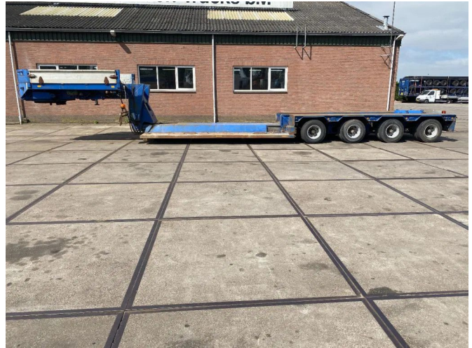
Goldhofer 4 AXEL STEERING