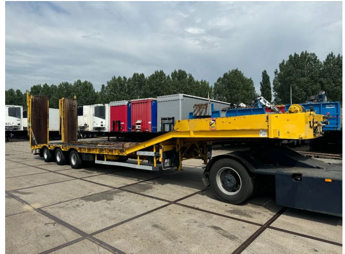
Castera 3SS 34 T 3 AXEL