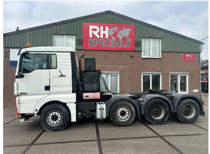
MAN TGX 41.540 160 TON, FULL STEELSPRING, MA... 8x4