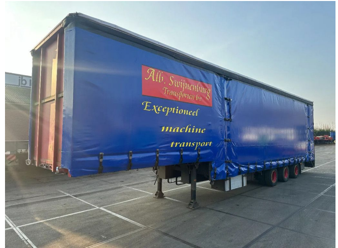
Jumbo EXTENDABLE REAR PORCH, SLIDING ROOF