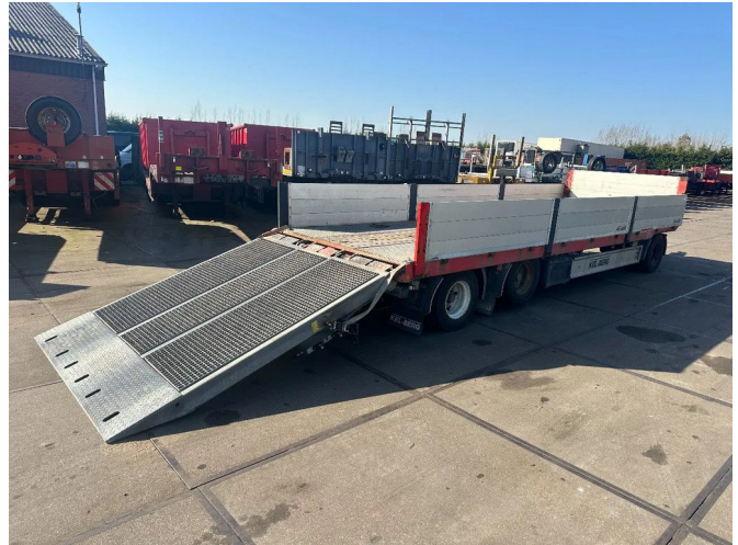
Kel-Berg 3 AXLE , RAMP 2E LIFT AXLE