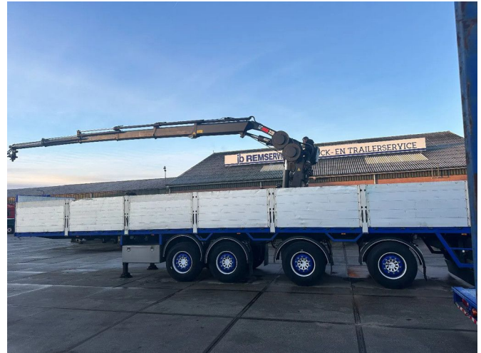
Pacton HIAB ROLLER 220 F5, 4 ASSIGE, 2 LIFT + 2 STUUR...