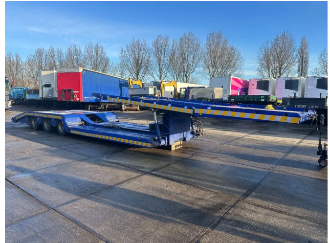
VS MONT 3 TRUCKS + WINCH