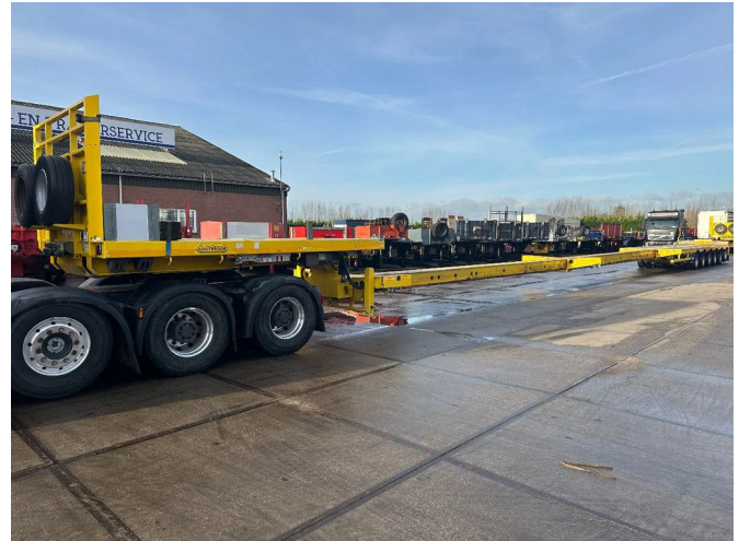
Nootboom MCO-85-06 V, DOUBLE EXTENDABLE 33,42 M...