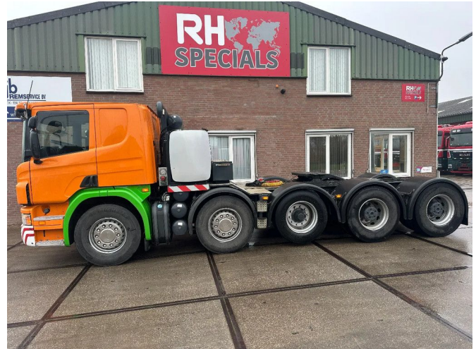
Scania P420 10X4 MANUEL GHEARBOX, 150 TON, HUB R...