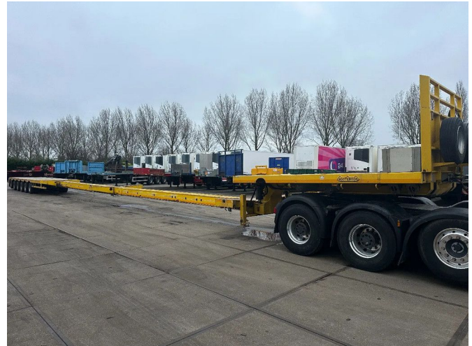
Nootboom MCO-85-06 V, DOUBLE EXTENDABLE 33,42 M...