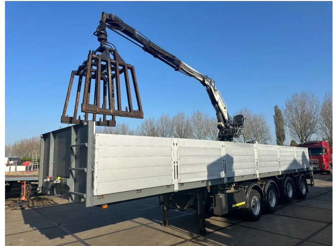
Floor KENNIS R14/6.00 2 STUUR EN 2 LIFT ASSEN