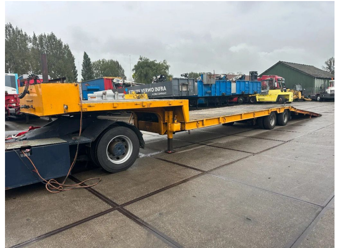
DEMICO 2 AXLE STEELSPRING