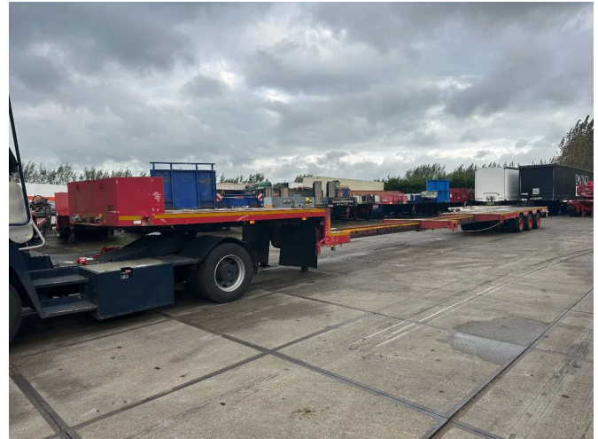
DEN OUDSTEN TRAILERS 3 AXLE FORCED STEERIND 2 X...