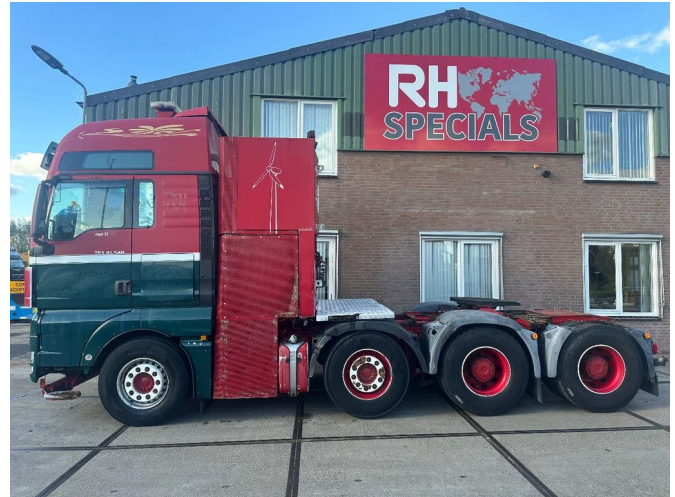
MAN TGX 41.540 8X4 180 TON RETARDER