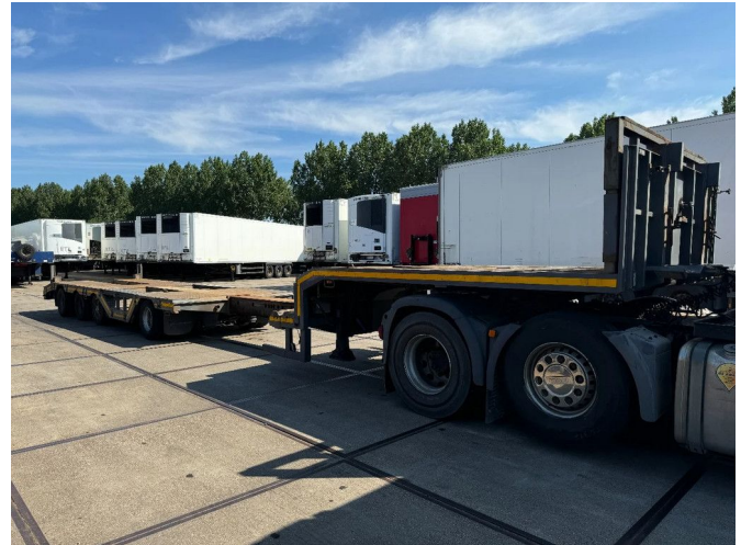
Floor 4 AXLE, 3,15 M EXTENDABLE, WIELKUIP EN GIEKSL...