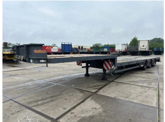
Nooteboom LAST AXEL STEERING