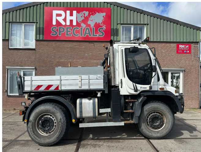
Unimog U400 SCHADE