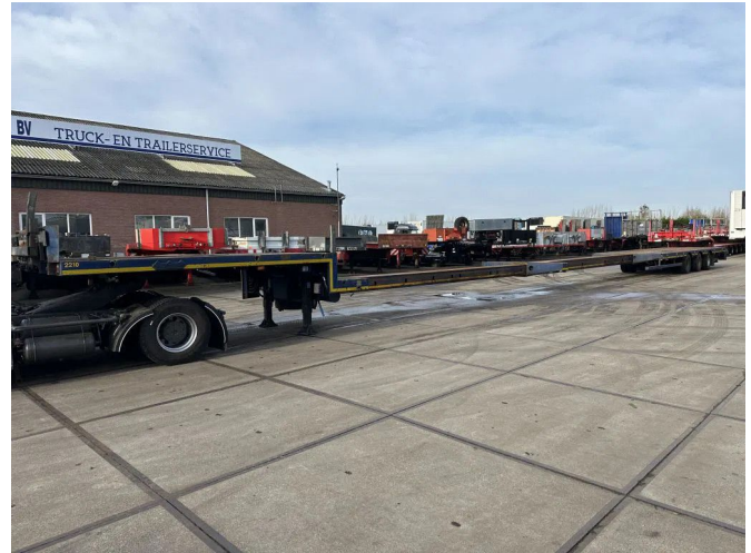
Nooteboom DOUBLE EXTENDABLE, TOTAL 26.53 METERS