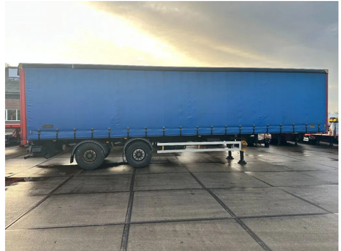
VAN HOOL LAST AXEL STEERING, LIFT 2000KG