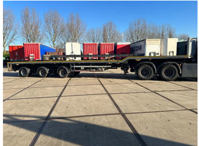
Broshuis 3 X EXTENDABLE TOTALE 42 M + EXTENSION T...