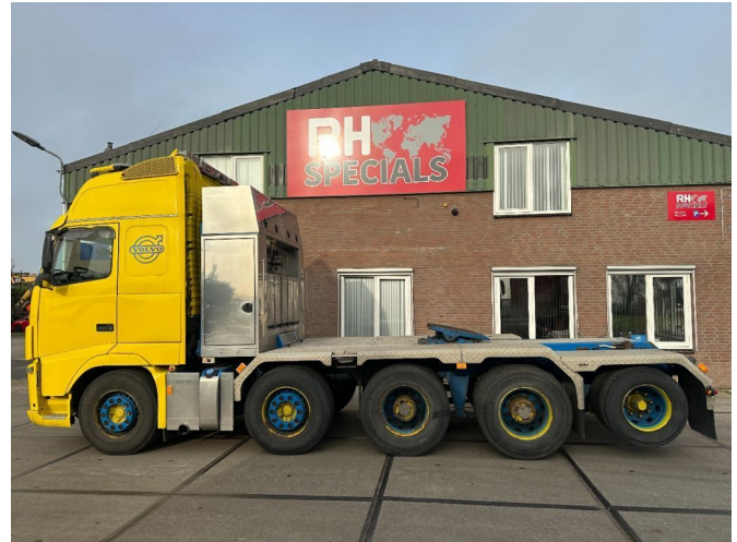
Volvo FH 16.610 145 TON INTARDER, HYDRAULIC, 10X4, ...