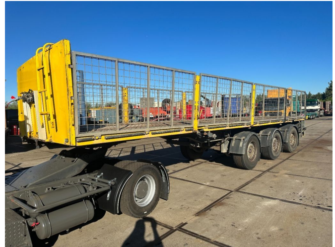
LAG O-3-39-LS 10,85M