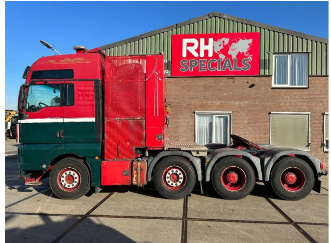
MAN TGX 41.680 V8 250 TON 381123 KM