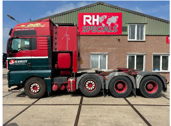
MAN TGX 41.540 8X4 180 TON RETARDER