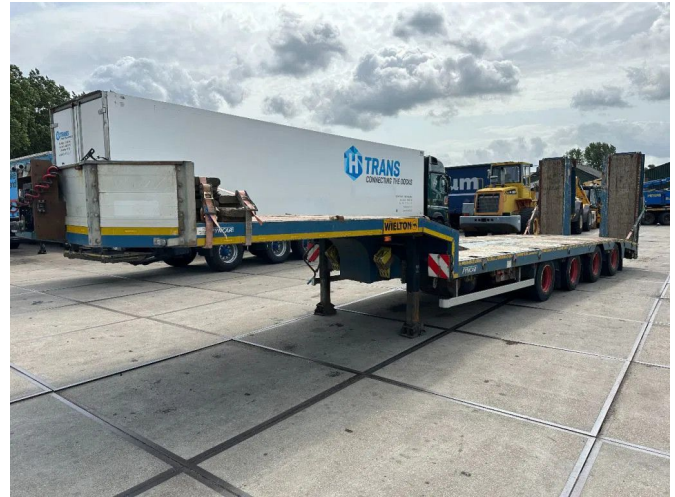
Wielton 4 AXEL WITH RAMPS