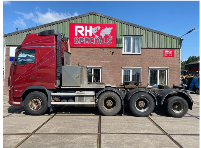
Volvo FH 16.700 FH16-700 8X4 140 TON FULL STEEL