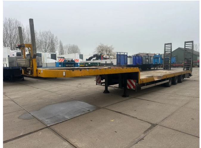
HRD 3 AXLE, HYDRAULIC RAMPS, LAST AXLE STEERING