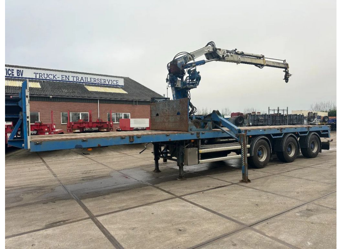
Floor MET HIAB R165-F2, LAATSTE 2 ASSEN GESTUURD