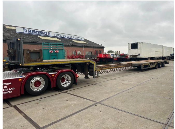
Floor 3 AXLE, 6 M EXTENDABLE, WHEEL FILLS