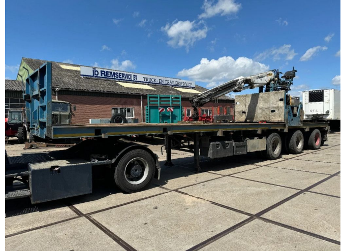
Floor FLO 17 30 H2 + KENNIS R-36 DRUM BRAKES