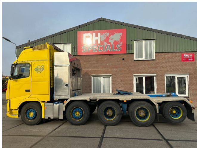
Volvo FH 16.610 145 TON INTARDER, HYDRAULIC, 10X4, ...