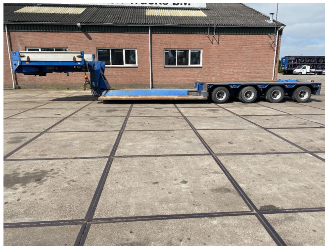
Goldhofer 4 AXEL STEERING